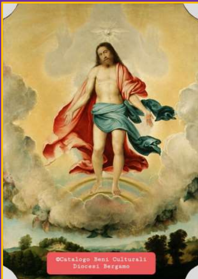
Giovanni battista Moroni, Trinità , sec. XVI, Chiesa San Giuliano, Albino (Bg)