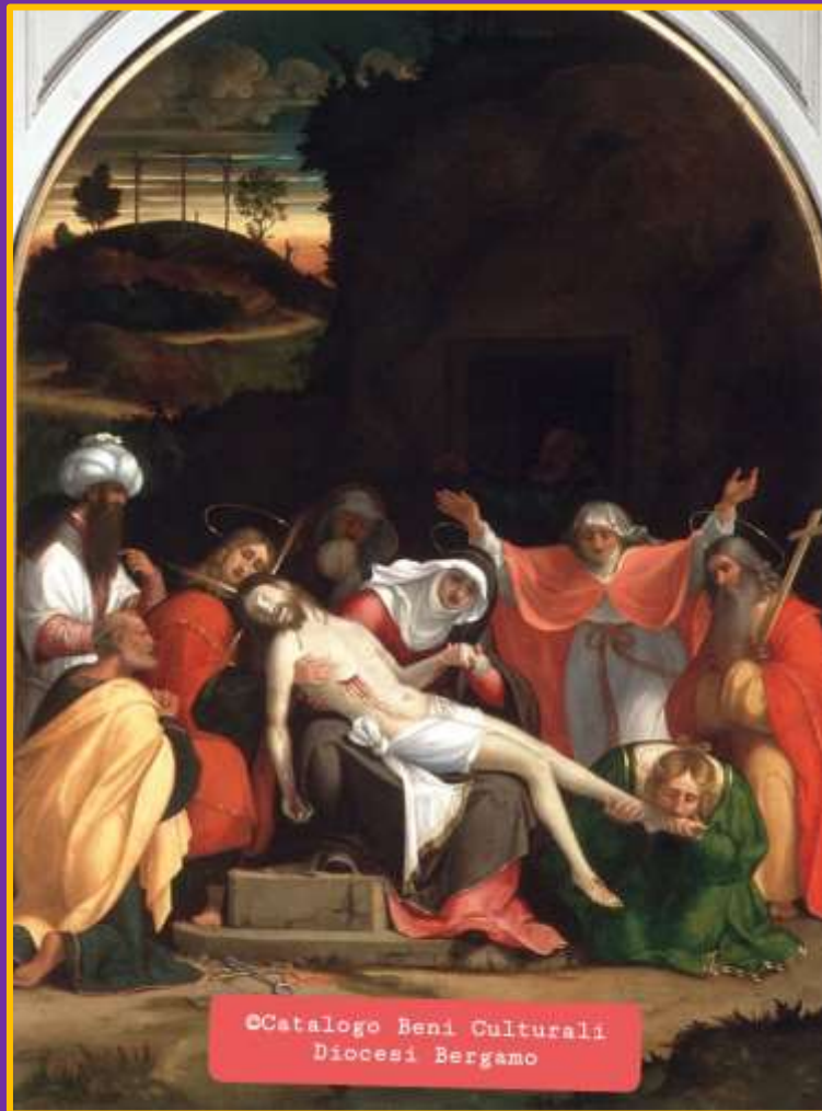
Lorenzo Lotto, Deposizione nel sepolcro , 1516, Accademia Carrara, Bergamo