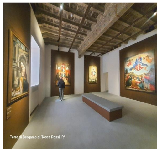
Terre di Bergamo di Tosca Rossi R*