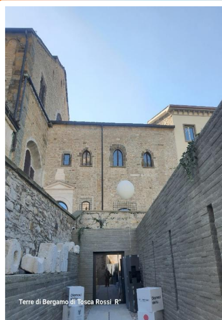
Terre di Bergamo di Tosca Rossi R*