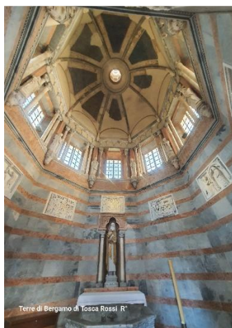
Terre di Bergamo di Tosca Rossi R*