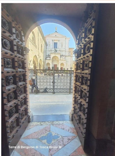
Terre di Bergamo di Tosca Rossi R*