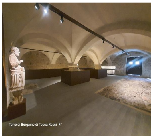
Terre di Bergamo di Tosca Rossi R*